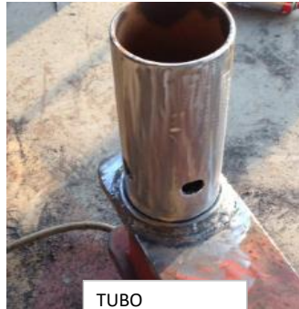
TUBO REEMPLAZADO Y